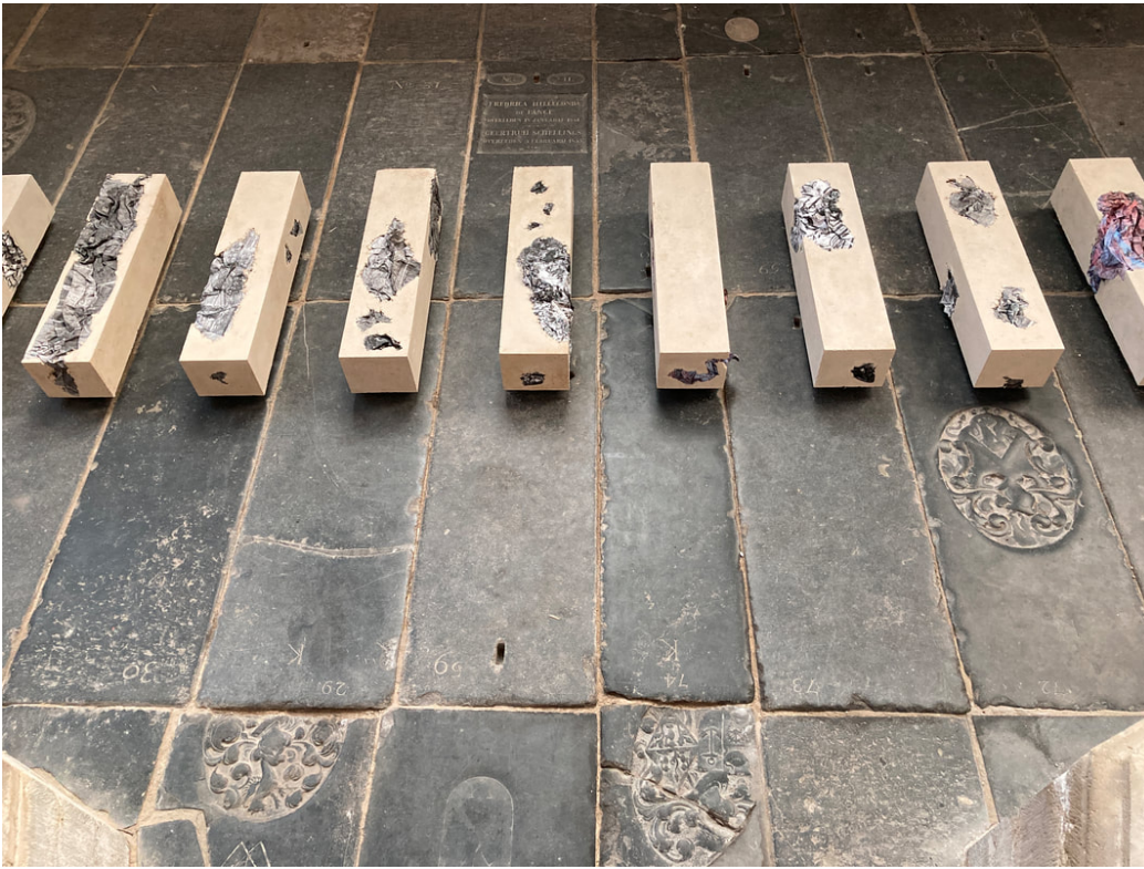
Werk van Aimee Zito Lema Oude Kerk 2021 credits Aimee Zito Lema

Vanaf 15 april staan de deuren van de Oude Kerk open voor een contemplatieve wandeling op reguliere openingstijden. Na het reserveren van een tijdslot, en het bevestigen van een gezondheidsverklaring, kan de wandeling beginnen. Je krijgt een kop warme thee mee, want in de kerk is even koud als buiten. Onderweg kom je de nieuwe installatie van Aimée Zito Lema tegen waarin gedichten worden voorgedragen en kun je een kaarsje opsteken. Er wordt geen entree geheven, al is een donatie in deze tijd van harte welkom. Mensen van de Oude Kerk staan in de kerk open voor een gesprek, lang of kort.